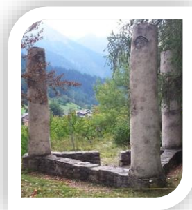
Ein Gerichtsstuhl im Wallis (Ernen)

Auf einem Galgenhügel, auch Gerichtsstuhl genannt, fanden im Mittelalter öffentliche Hinrichtungen von Verurteilten durch den Galgen statt. Hunderte von Hügeln oder Bergen tragen im deutschen Sprachraum diese Bezeichnung. Die Stätten lagen meist an der Markungsgrenze von Orten mit eigener Blutgerichtsbarkeit und wurden zur Abschreckung gerne an stark frequentierten Wegen und Kreuzungen oder weithin sichtbar auf Hügeln platziert.